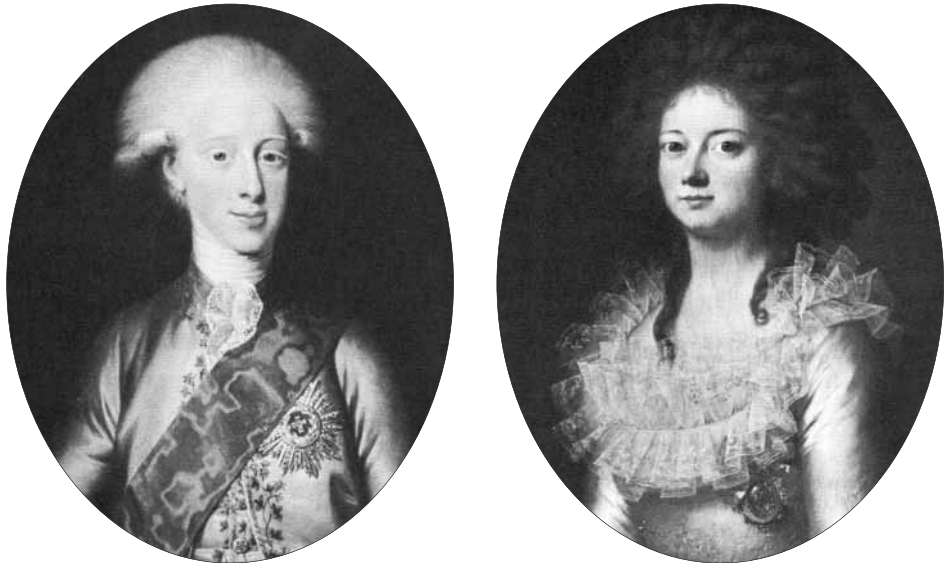
Fig. 1. Jens Juels portrætter af Frederik og Marie. Gengivet efter Politikens Danmarks-historie.

Hertil ankom Kronprins Frederik (1768 – 1839; kong Frederik VI 1808 – 1839) nitten år gammel i 1787. Alle vidste, han var ude efter en brud, og han valgte da også sin et år ældre kusine. Valget var ikke populært; tyske Marie kunne ikke et ord dansk, statsadministrationen var stærkt præget af tysktalende embedsmænd,