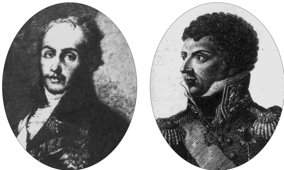
Fig. 2. Romana og Bernadotte. Gengivet efter SKALK.

I 1807 besluttede Napoleon at løse problemet Portugal. Det portugisiske kongehus, Braganza, var lige så udlevet som det spanske. Kongen af Portugal var sindssyg og dronningen mentalt handicappet. Det lyder hårdt, men det er den rene sandhed. Fra deres side kunne Napoleon ikke vente nogen fare. Truslen kom derimod fra de portugisiske havne, som englænderne kunne benytte ved en eventuel invasion på den iberiske halvø. Det kunne Napoleon ikke se bort fra – så meget mindre som han to år i forvejen havde tabt søslaget ved Trafalgar, og resterne af den engelske flåde var gået ind i portugisisk havn. Han indgik nu en aftale med Carlos 4. (reelt med Godoy) om, at de sammen skulle erobre Portugal og dele landet. Derefter sendte han franske tropper på gennemmarch ned i Spanien. Her blev de franske tropper i begyndelsen modtaget med høflighed og al venskabelighed af den spanske befolkning. Imens skyndte familien Braganza sig at flygte fra Lis-