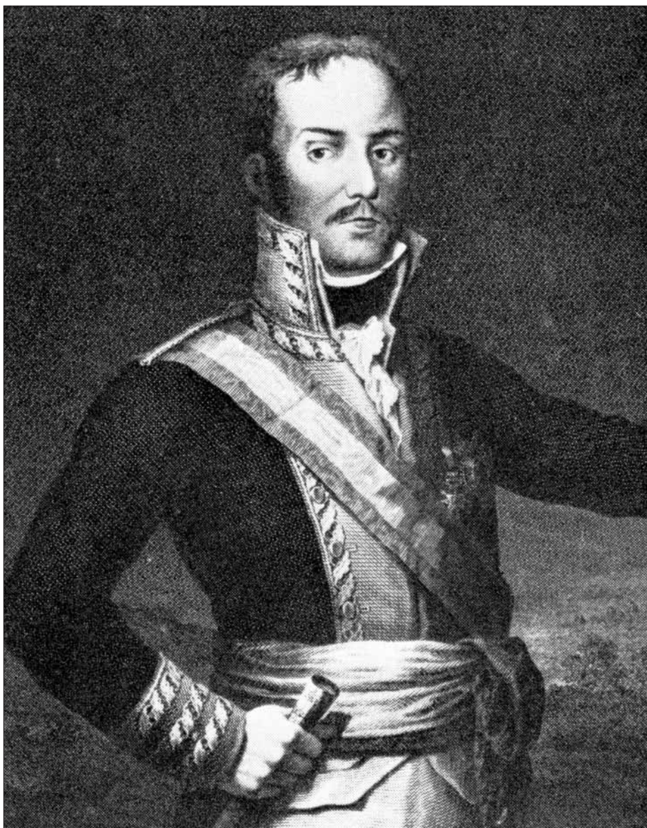
Fig. 6. Marquis de la Romana. Kobberstik. Gengivet efter «London 1793 – 1815».

sen. Napoleons krigsvante tropper nedkæmpede de spanske styrker. Mangen en af dem, der havde nydt tilværelsen på Fyn, fandt døden, så snart de nåede hjem. Romana tabte flere slag mod franskmændene, men så greb englænderne ind, og de franske begyndte at vige. Romana blev gjort til chef for partisanstyrken, som skulle føre »den lille krig« = guerillaen. Her var han kommet på