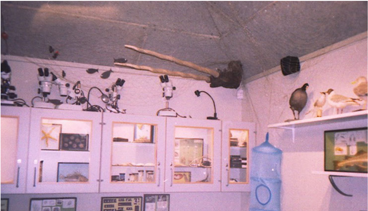
Fig. 4. Apoteker Sibbernsens enhjørningstand hænger i dag i Fjord- og Bæltcentrets showroom.