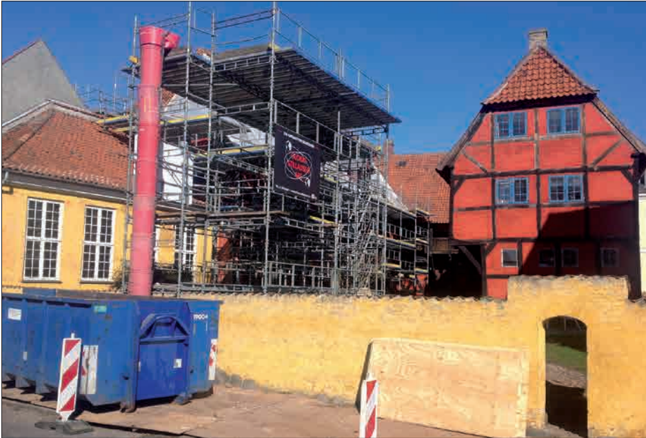
Fig. 7. Borgmestergården med stillads.

Borgmestergården skal være et endnu mere attraktivt besøgssted og et vigtigt led i fortællingen omkring Nyborg Slot.