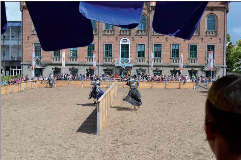
Fig. 3. Som sædvanlig blev der dystet med lanser på turneringsbanen under årets Danehof. Sådan ser det ud fra kongens tribune.

Ligesom Danehofmarkedet skal bringe både slottet og byen til live, som da Danehofferne mødtes i Nyborg, er Nyborg Kampdage et initiativ, der skal bringe fordums magt og pragt til live. Stridsmænd fra hele landet og store dele af Nordeuropa mødes for at træne og udkæmpe et middelalderligt storslag. Fra en meget beske-