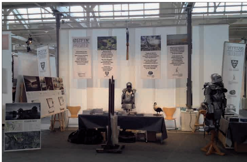
Fig. 6. Klar til Historiske Dage i Øksnehallen i København.

Nyborg Slot og Nyborg Bibliotek samarbejdede som sædvanlig om en række spændende aktiviteter i forbindelse med Forskningens Døgn 25.-30. april 2016. Her satte vi fokus på den forskning, der har gjort det muligt, at man nu kan skabe en for-