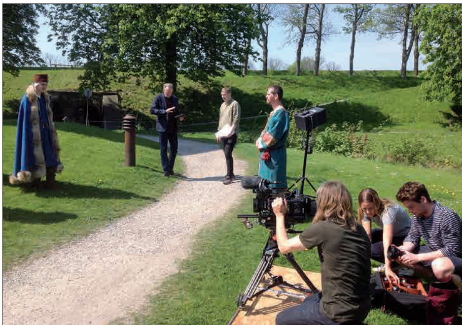
Fig. 4. DR optager Historien om Danmark på slottet. Værten, Lars Mikkelsen, forbereder sig sammen med filmholdet og statisterne i dragtlaugets fantastiske dragter.

Danmarks Radio har været travlt optaget af optagelserne til den nye store Danmarkshistorie, der skal vises i nu 10 afsnit i løbet af 2017. Nyborg Slot har fungeret som kulisse for en række af optagelserne til både middelalderen og renæssancen. Nyborg Slots dragtlaug har leveret en række af dragterne til optagelserne, der er blevet rost og flittigt benyttet af DR både på grund af deres historiske korrekthed og kvalitet. I det hele taget satser museet på at udvikle aktiviteter, der kan være med til at understøtte fortællingen lokalt og sætte fokus på de steder i vores område, hvor man kan opleve den store historie lokalt.