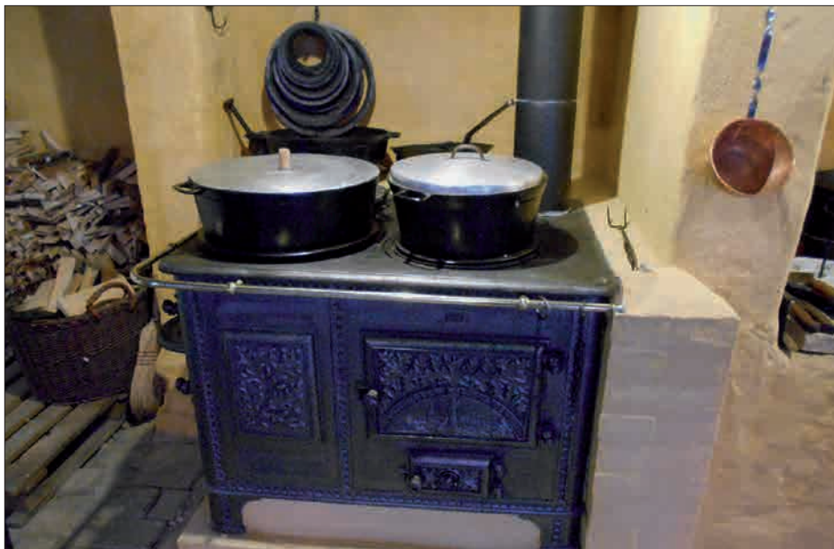
Fig. 8. Borgmestergårdens nye gamle komfur.

Man kunne møde Rumleskaft, Askepott, Rødhætte og andre både kendte og ukendte figurer fra Grimms eventyr, hjælpe med at løse stedmørens onde opgaver, fylde Rødhættes kurv med gode sager til bedstemor, finde