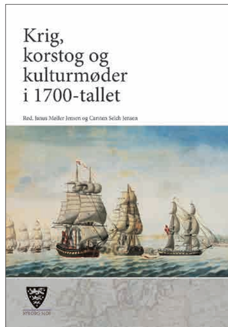
Fig. 9. Forsiden til den roste Krig, korstog og kultur møder, ligesom Christian 2. bogen produceret i samarbejde med Mark og Storm Grafisk.

Hen over vinteren er de nye magasinlokaler blev et renoveret og udstyret med reoler, og i 2017 forestår det