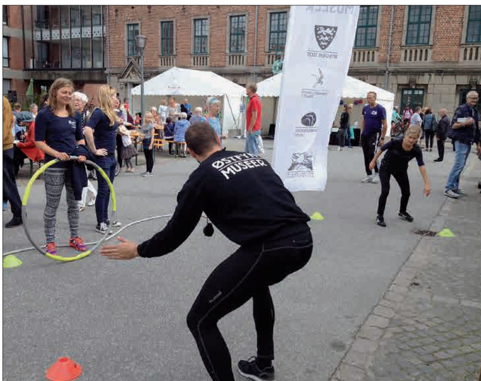
Fig. 2. Billede fra den dramatiske dyst i Knights' Corner mellem Østfyns Museer og Sundhedsamazonerne fra Sundhedsafdelingen i Nyborg Kommune, der vel nærmest endte uafgjort.