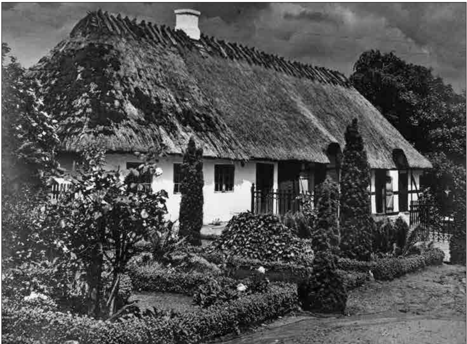
Fig. 1. Den første skole i Vindinge. Opført 1740.

I 1740 blev den første skole i Vindinge bygget. Den bestod af en lille stråttækt bindingsværksejendom med degnebolig til den ene side og et klasseværelse til den anden, og huset var sammenbygget med en lille ladebygning. Skole og kirke var på den tid uløseligt forbundne, og bygningen var da også placeret direkte på kirkegården med udsigt til buksbomhække