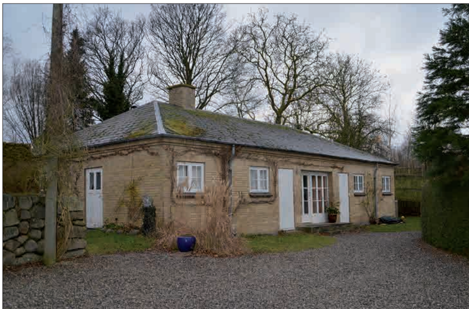
Fig. 9. Annekset.