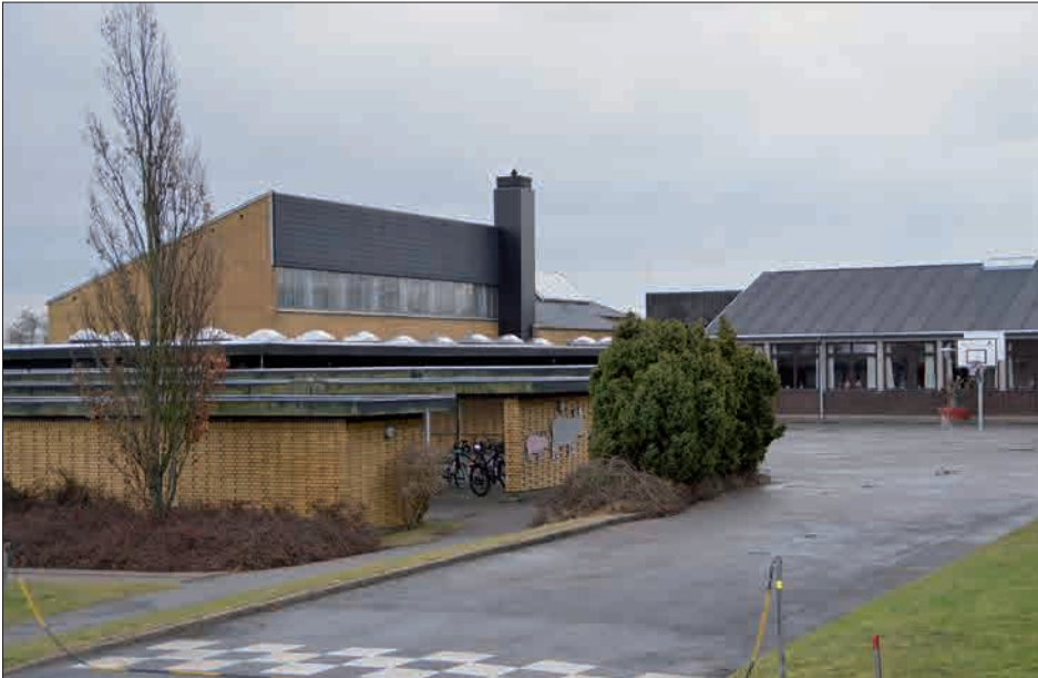
Fig. 10. Den nyeste skole i Vindinge.