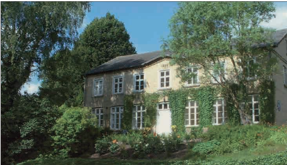
Fig. 8. Skolebygningen fra 1890.

De to lærere var efter sigende ganske afholdte og respekterede af eleverne, og fysisk afstraffelse var ikke almindelig. Christensen kunne dog