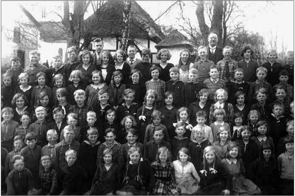
Fig. 6. Skolefoto fra 1932. I baggrunden ses den gamle bindingsværksbygning fra 1740 og det lille lokumshus. Vindinge Kirke og gavlen af den nye skole kan anes til venstre i billede.