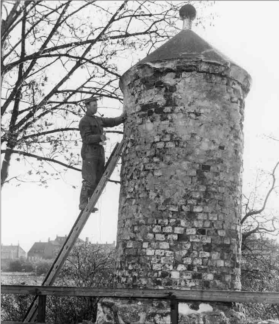
Fig. 3. Foto 1966. V1167.