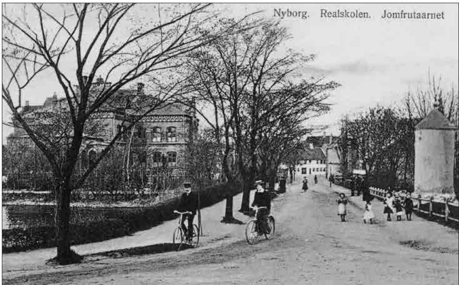
Fig. 1. Postkort, ca. 1910. Palisaden mellem Jomfrutårnet og Kamgraven gik tværs over det, der i dag er Kongens Bastionsvej. V1167, Nyborg Lokalhistoriske Arkiv.

Gennem århundrederne har Jomfrutårnet – efter det mistede sin oprindelige funktion – stået som et mere eller mindre mystisk monument i