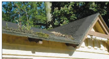
Figur 6-8. Omklædningshytten i forfald før renovering i 2006.