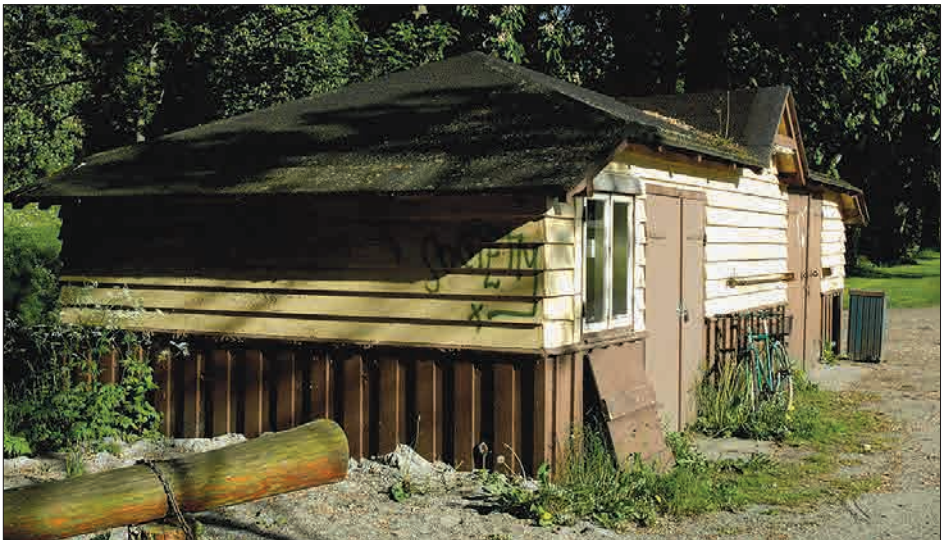
Figur 1. Omklædningshytten i forfald før renovering i 2006.

I sommeren 1899 afholdtes på eksercerpladsen en stor gymnastik- og idrætsfest med mange kendte idrætsmænd som deltagere. Denne fest bevirkede en så stor interesse for friluftssport, at der i Nyborg blev stiftet en ny forening »Nyborg Fodsporsklub« – fodspors var datidens betegnelse for fodbold.