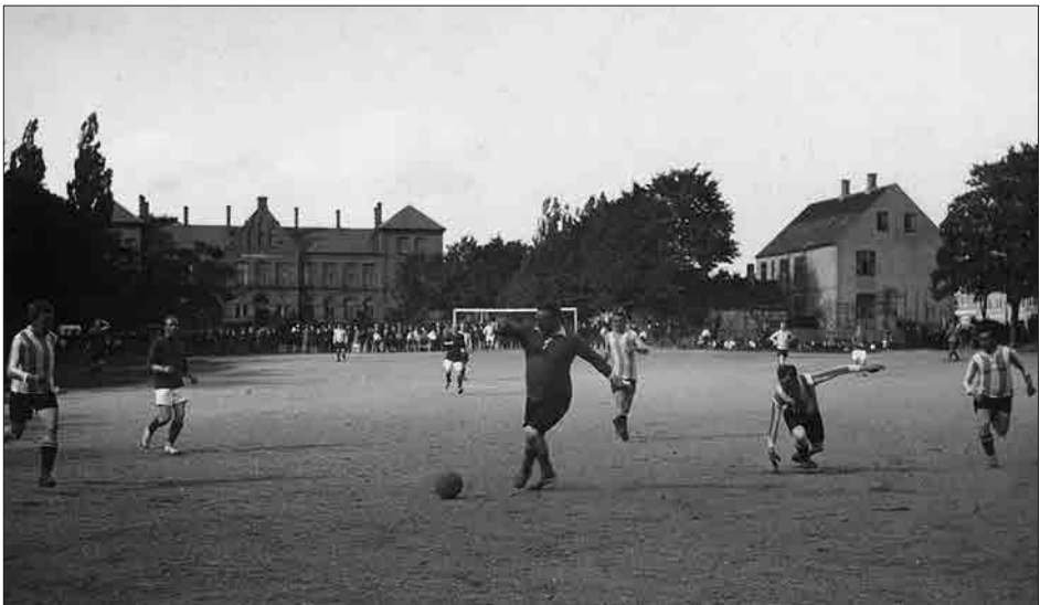
Figur 3. Velgørenhedskamp i fodbold på Eksercerpladsen i 1922. I midten med bolden slagtermester Urban Sørensen.

Forinden var pladsens udnyttelse dog blevet livligt diskuteret i de loka-