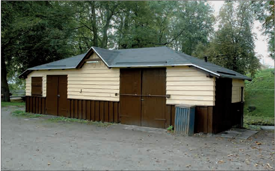
Figur 5. Den lille bygning renoveret 2006.

Brædderne skal være absolut fri for råd, gennemgående ridser og løse knaster.