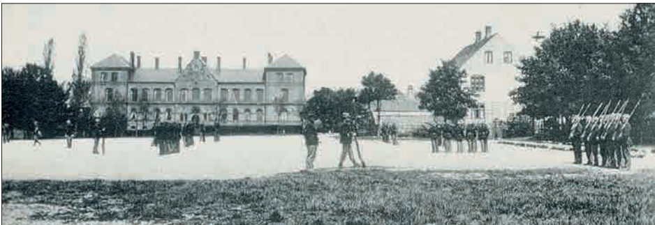
Figur 9. Eksercerpladsen ca. 1900. Den imponante bygning i baggrunden er Den kgl. Døvtummeskole (1891), der af ikke stedkendte er blevet opfattet som kaserne pga. samspillet med eksercerende soldater.

Sidst i september 2016 var der en omfattende udvendig renovering, hvilket var tiltrængt. Vi håber, Nyborg Kommune vil bevare den historiske omklædningshytte for eftertiden.